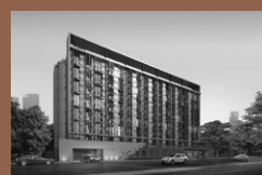
Altitude Samyan-Silom : Condominium