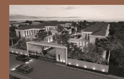
Altitude Mastery Phahoyothin 24 : Single House