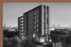
Altitude Define : Condominium