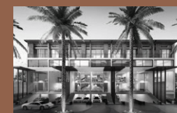
Oasis Loft Sukhumvit 64 : Home Office