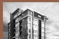
Okas Sukhumvit 105 : Condominium