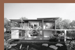
X2 Hua Hin Oasis : Pool Villa